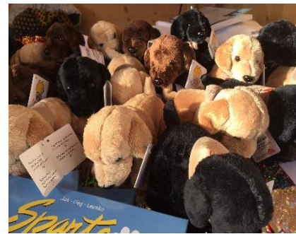
Photos : chalet décoré, nounours des Gobelins et les goodies en vente.