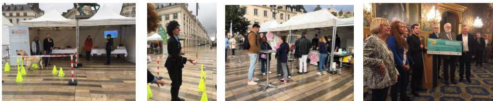
Photos : animations tout au long de la journée et remise du don (voir infra)

Organisée le samedi 19 octobre, place du Martroi, par les commerçants d'Orléans, les Clubs services et la Ville, la Fête du tri, dont c'était la 3 e édition, a connu un franc succès malgré la pluie.