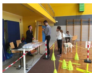
Photos : stand et parcours sur le Forum