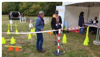
Photo : parcours de mise en situation